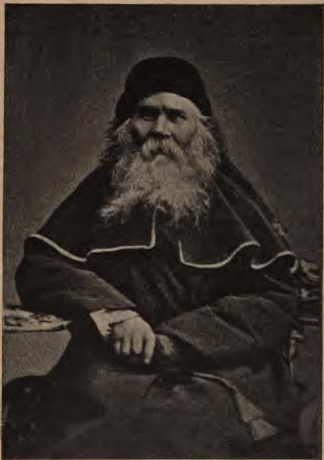
Кононъ, епископъ Новозыбковскій.